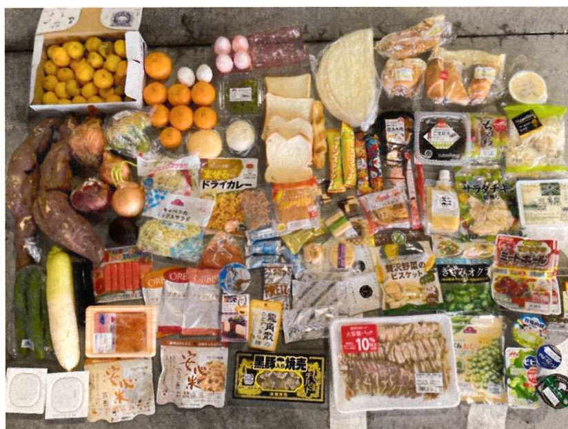
可燃ごみに入っていた食品ロス（直接廃棄）の一部