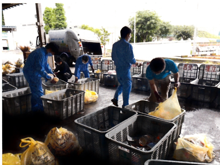
組成分析調査の様子