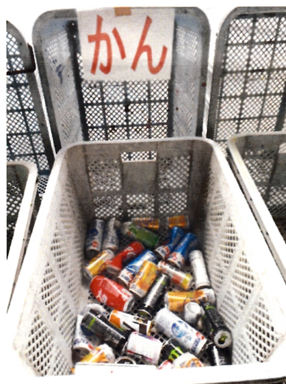
分別不適ごみの例（かん）